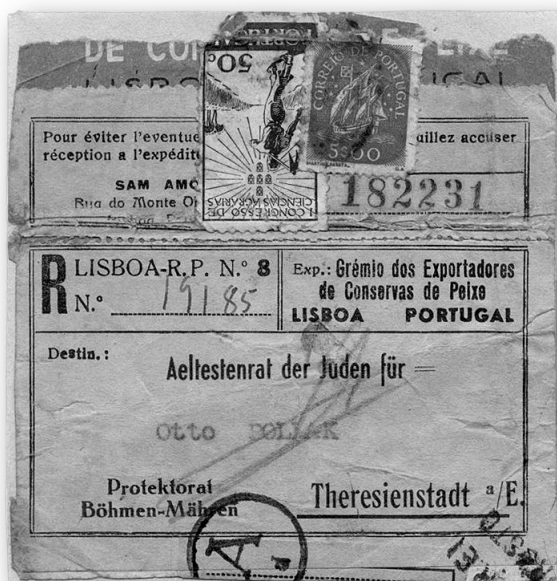
Adresní nálepka zásilky sardinek z Lisabonu pro příjemce v ghettu, adresovaná radě starších do Terezína.