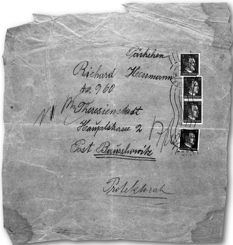
Obal z balíčku zaslaného z říšského území do ghetta v Terezíně. |PT|