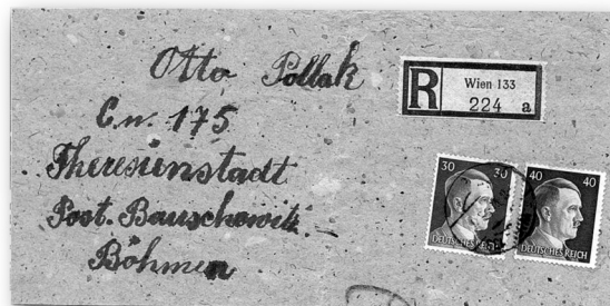
Část obalu balíčku zasláno doporučeně z Vídně do ghetta v Terezíně.