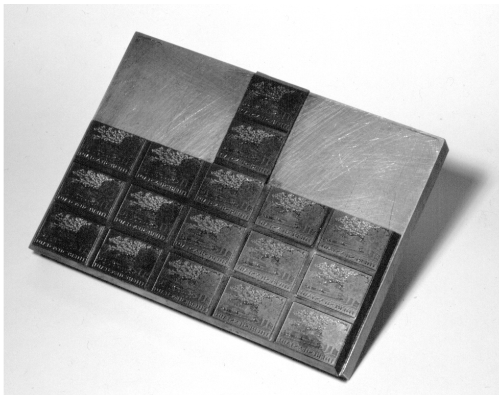
Torzo původní tiskové desky připouštěcích známek po odříznutí obou rohových čtyřbloků. /STC/