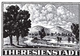
krajina u Terezína

1943, 10. července. Balíková připouštěcí známka pro ghetto Terezín. Návrh B. Fojtášek podle obrazu F. Šimbery. Knihtisk, vytištěno v Tiskárně bankovek Národní banky pro Čechy a Moravu v Praze; papír kvalitní, hladký, mírně nažloutlý, na zadní straně s hladkým lesklým lepem; Řz 10 1/2 (A), část nákladu nezoubkovaná (B), resp. Řz 10 3/4 (C). Tisková forma: 25 známkových polí (A nebo B - rozměr tiskového listu 233 x 170 mm) nebo 4 známková pole (B nebo C - rozměr tiskového listu 233 x 170 mm, resp. C - rozměr tiskového listu 132 x 110 mm).