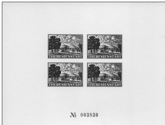
Faksimile propagačního aršíku pro Červený kříž, které bylo přílohou prvního vydání této knihy.