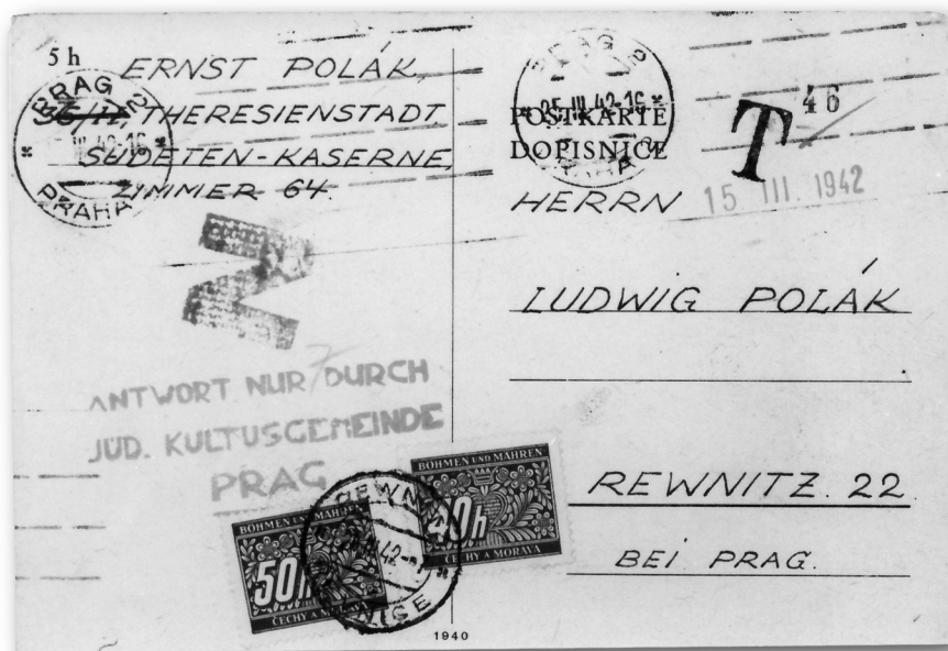
Dopisnice z ghetta do protektorátu. V adrese odesílatele uvedeno bydliště v Sudetských kasárnách a číslo pokoje. Přijetí stvrdila pošta v ghettu datovým razítkem 15. III. 1942. Cenzorský zásah vyznačen razítkem Z a číslem cenzora 7. Zásilka byla podána na poštovním úřadě Praha 2. Doplatní známky byly znehodnoceny razítkem dodacího úřadu v Řevničích. [PT]