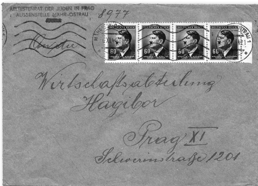
Dopis ŽRS v Praze, pobočka v Moravské Ostravě, adresovaný hospodářskému oddělení (sběrného tábora) v Praze-Hagiboru, odeslaný 6. 12. 1944.