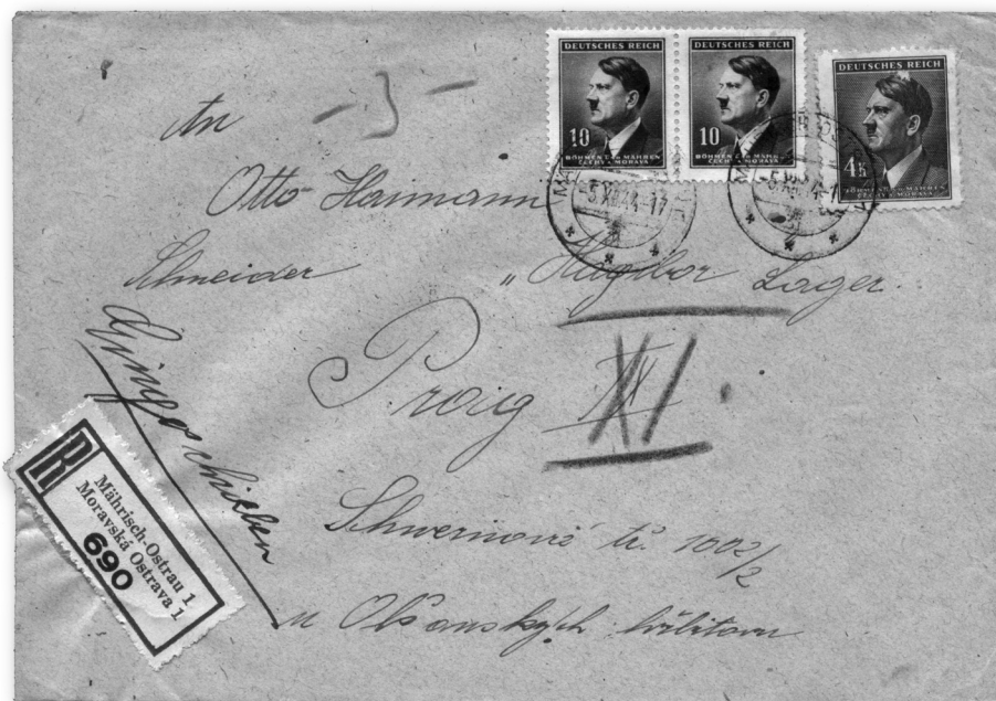
Doporučený dopis odeslaný 5. 12. 1944 z Moravské Ostravy do tábora v Praze-Hagiboru. [Soukromá sbírka, ČR]