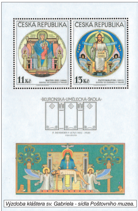
Výzdoba kláštera sv. Gabriela - sídla Poštovního muzea.

kočárem taženým čtyřspřežím kladrubských běloušů – z Celetné ulice přes Čechův most po nábřeží do tehdejšího Parku kultury a oddechu Julia Fučíka, kde probíhala hlavní část výstavy. Já měl na starosti provoz kočáru, ale pomáhal jsem i s historickou expozicí, a protože jsem měl řidičský průkaz, měl jsem na starosti i služební dodávku Škoda 1203.