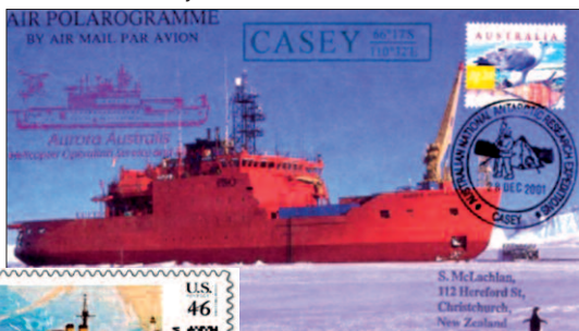
Ledoborec Aurora Australis.