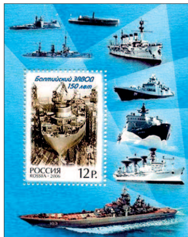
Baltické loděnice v Petrohradě.

Ledoborec 50 let vítězství , o němž bude řeč dnes, se pohybuje na opačné straně zeměkoule - v Arktidě. Jde o největší a nejmodernější loď svého druhu na světě, do provozu byla uvedena v roce 2007. To zjevně nekoresponduje s jejím názvem, odkazujícím k roku 1995, kdy bylo půlstoletí konce druhé světové války připomínáno. Finanční problémy po rozpadu SSSR ale způsobily, že stavba ledoborce v Baltických loděnicích v Petrohradě byla na řadu let přerušena.