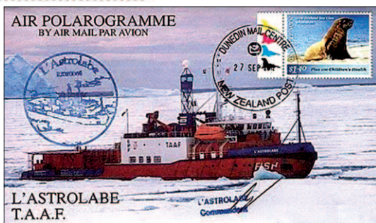
Ledoborec L' Astrolabe.

Ledoborec 50 let vítězství , o němž bude řeč dnes, se pohybuje na opačné straně zeměkoule - v Arktidě. Jde o největší a nejmodernější loď svého druhu na světě, do provozu byla uvedena v roce 2007. To zjevně nekoresponduje s jejím názvem, odkazujícím k roku 1995, kdy bylo půlstoletí konce druhé světové války připomínáno. Finanční problémy po rozpadu SSSR ale způsobily, že stavba ledoborce v Baltických loděnicích v Petrohradě byla na řadu let přerušena.