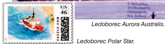
Ledoborec Polar Star.