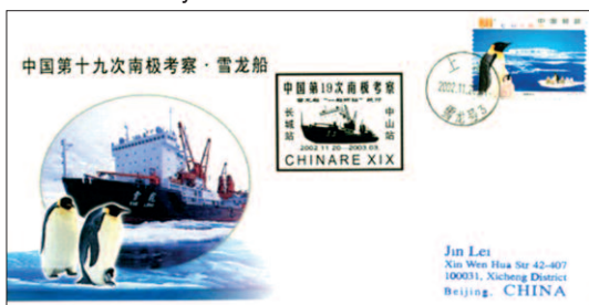
Ledoborec Sněžný drak.

O ledoborcích jsme nedávno hodně slyšeli a četli ve sdělovacích prostředcích, v souvislosti se snahou vyprostit ruské plavidlo Akademik Šokalskij, uvízlé v ledu s výpravou vědců u břehů Antarktidy. Na pomoc mu přispěchaly hned čtyři ledoborce - čínský Sněžný drak , australský Aurora Australis , americký Polar Star a francouzský L' Astrolabe . Všechny můžeme dokumentovat filatelicky.