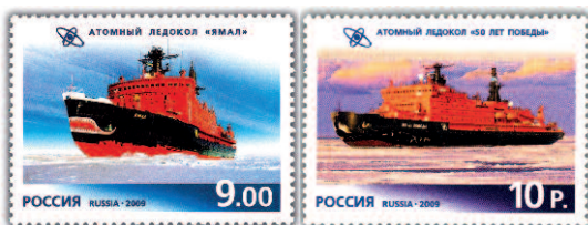
Atomové ledoborce Jamal (vlevo) a 50 let vítězství .

Po spuštění na vodu doplnil v komerčních plavbách na severní pól atomový ledoborec Jamal , který s přídí ozdobenou kresbou ozubené mořské příšery brázdí vody Severního ledového oceánu od roku 1992.