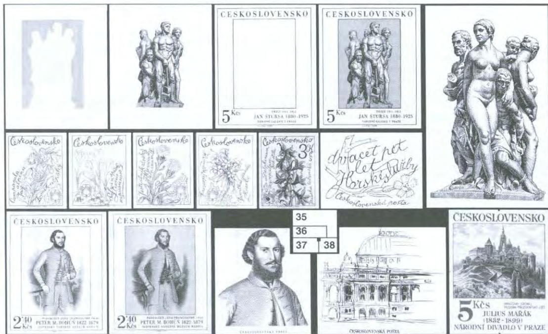
Obr. 35: Tři otisky rytin pro jednotlivé barvy známky 5 Kčs z emise Umění 1980, jejich soutisk a otisk rytiny pro FDC téže známky.