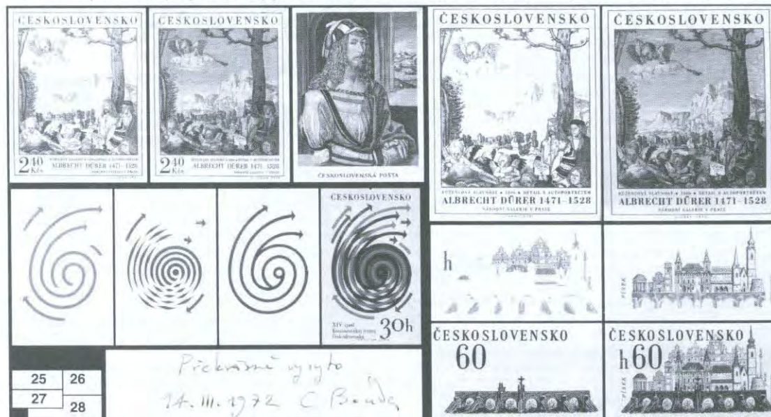
Obr. 25: Otisk rytiny pro černou barvu, barevný soutisk a otisk rytiny pro FDC známky 2,40 Kčs Růžencová slavnost z emise Umění 1971.