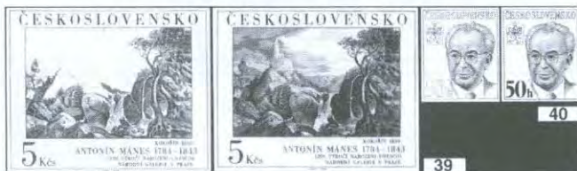
Obr. 40: Dva různé otisky rytiny známky 50 h Gustav Husák 1983.