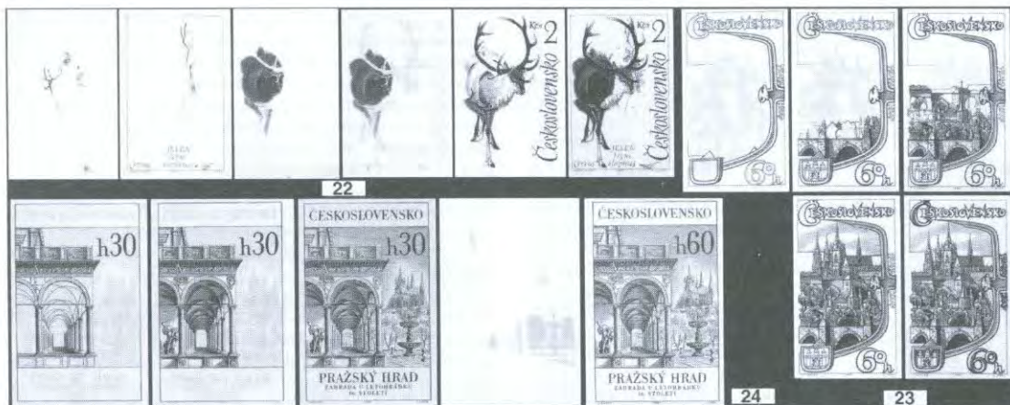
Obr. 22: Pět otisků rytin pro jednotlivé barvy známky 2 Kčs Zvířena 1964 a jejich soutisk.