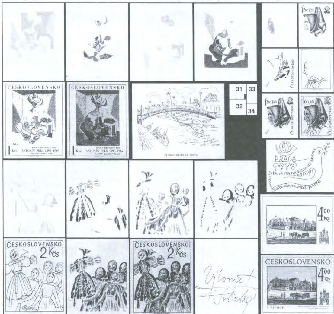
Obr. 31: Pět otisků rytin pro jednotlivé barvy, jejich soutisky a otisk rytiny pro FDC známky 1 Kčs Hoch z Martinique z emise Umění 1973. Na originále soutisku je vidět, že původně byla připravena pro pozadí světle modrá barva.