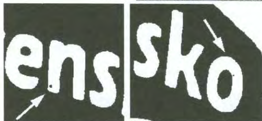
Obr. 7: Tečky v písmenech „n“ (23. ZP) a posledním „o“ (25. ZP) v názvu státu u aršíku VII. typu.

Na 18. ZP aršíku VII. typu je vedle drobné skvrnky v posledním „o“ v názvu státu (je popsána dále) i charakteristické poškození prostředního „o“ v názvu státu - šikmé nebo vyštipnuté zakončení vnitřního oválu v jeho horní části (obr. 8).