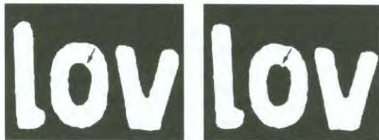
Obr. 8: Šikmé nebo vyštipnuté zakončení vnitřního oválu prostředního písmene „o“ v názvu státu v jeho horní části na ZP 18 u aršíku VII. typu.

Na 18. ZP aršíku VII. typu je vedle drobné skvrnky v posledním „o“ v názvu státu (je popsána dále) i charakteristické poškození prostředního „o“ v názvu státu - šikmé nebo vyštipnuté zakončení vnitřního oválu v jeho horní části (obr. 8).