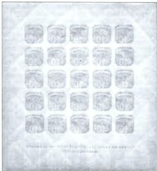
Obr. 5: Otisk sušičního roštu protlačený v papíru aršíků VII. typu (pohled na zadní stranu aršíku).

ostrůvky tmavšího odstínu, tvořící jakési „mramorování“. Barva známek ostatních aršíků je jasnější, homogenní, případné tmavší skvrnky v plochách nejsou nijak výrazně kontrastní.