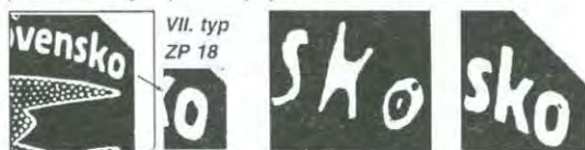
Obr. 12: Nesprávná vyobrazení 18. ZP aršíku VII. typu v Monografii /13/ (vlevo) a v článku Novinový aršík Bratislava /14/ (uprostřed); vpravo skutečný vzhled tohoto ZP.

V tabulce rozlišovacích znaků, uvedené v už zmíněném článku Novinový aršík Bratislava /14/, jsou typické deskové vady vesměs vyfotografovány z originálů příslušných ZP; 18. ZP aršíku VII. typu je však pouze velmi nepřísně nakresleno (obr. 12). Z uvedených příkladů je zřejmé, že dokonce ani autoři takto úzce specializovaných prací neměli s největší pravděpodobností aršík VII. typu k dispozici - což jen potvrzuje jeho mimořádnou vzácnost.