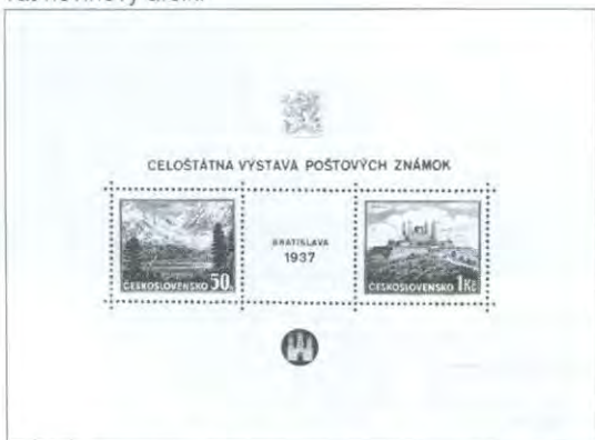
Obr. 2: Bratislavský aršík vydaný k propagaci Celostátní výstavy poštovních známek Bratislava 1937.

Československa". K propagaci výstavy byl však určen především druhý bratislavský aršík - dvouznámkový, s vyobrazením Popradského plesa a Štefánikovy mohyly na Bradle, vydaný také v den zahájení výstavy, tedy 24. října 1937 (obr. 2). Abychom oba aršíky od sebe odlišili, budeme dvouznámkový aršík (Pof. č. A 329/330) v dalším textu nazývat bratislavský aršík a bratislavský novinový aršík (Pof. č. A N18) budeme zkráceně nazývat novinový aršík.