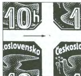
Obr. 6: Pravý dolní rohový čtyřblok známek z aršíku VII. typu s lehkým otiskem upevňovacího hřebu uprostřed.