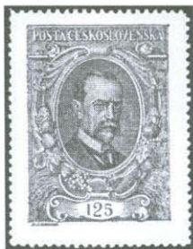
1. Známka 125 h vydaná v roce 1920 v rámci emise k 70. výročí narození prezidenta republiky T. G. Masaryka.

Známka vyšla (přesněji byla zjištěna v oběhu) 23. 9. 1920, tedy o více než půl roku později než dvě další - i když nominálně vyšší - hodnoty téže emise, nyní však katalogy tradičně řazené nikoliv podle data vydání, ale vzestupně podle nominálních hodnot. Nedlouho po vydání známky u ní sběratelé rozpoznali dvě varianty tloušťky číslic v hodnotovém údaji, které označili jako typy, a dále výraznou deskovou vadu - kratší příčku číslice 2 v hodnotovém údaji, nacházející se na 80. známkovém poli druhé tiskové desky. Mezi specializovanými sběrateli známka tradičně patří