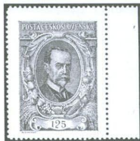
3. Známka s deskovou vadou - krátká příčka - pocházející z 80. známkového pole 2. tiskové desky.

Obě citovaná tvrzení monografie jsou přitom nesprávná. Výrazně tenčí číslice u známek v levém horním