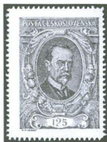
8. Známká s padělanou DV krátká příčka.

V minulých dnech mi však jako znalci byla předložena neupotřebená svěží známka 125 h TGM 1920 s deskovou vadou krátká příčka, u níž jsem po prohlídce musel konstatovat, že jde o padělek vzniklý odstraněním (vyškrábáním) tiskové barvy v části příčky hodnotové číslice. Na tom by nebylo nic zvláštního - kdyby známka nebyla označena znaleckými značkami dvou významných znalců ČSR 2) , s přídavnou značkou „krátká příčka“, a nebyl k ní dokonce připojen fotoatest (vystavený v květnu letošního roku) s textem „Tato známka má tzv. krátkou příčku u číslice '2' - je p r a v á.“ S tímto ověřením byla známka prodána na jedné aukci za cenu 4.000 korun. Nový majitel známku spolu s fotoattestem přinesl pro jistotu na kontrolu do