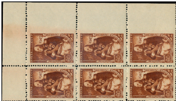
Svislý rohový 6-blok známek 60 k Kutuzov 1945, Mi. 982, s vynechaným zoubkováním na pravém okraji.

Vyskytují se na okrajích archů i mezi známkami. Jde o velmi nápadnou výrobní vadu, takže si jí nejspíš všimli už naši předchůdci. Otázkou ale je, zda ji také patřičně docenili – rozdíl mezi jednotlivými emisemi a jejich hodnotami (a místem vynechání) jsou totiž v některých případech propastné, podobně jako u naší emise Moskevské 1945. Vyskytují se zejména u známek ze 40. a 50. let, v určitých údobích dokonce skoro u všech emisí. Většinou se nacházejí v okrajích archu, méně často mezi známkami. Michel je obecně hodnotí minimálně 100 ME, nejsou však řídké případy záznamů mnohem vyšších – 300, 500, 800 a více ME). Tady je třeba podotknout, že nepochybně došlo k jisté dvoukolejnosti, kdy záznamy za standardní známky historicky vystoupaly na úroveň, která je zjevně odtržena od reálných cen, zatímco nově zařazené ceny za speciality jsou od cen tržních skutečně odvozeny, takže je na ně třeba použít zcela jiný přepočít.