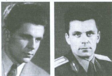
Obr. 2 a 3: L.D. jako vysokoškolák (asi rok 1947) a jako důstojník (v 50. letech).

I v době svého působení v armádě se věnoval filatelii, studoval literaturu pro svou zamýšlenou zanelekou a ju-