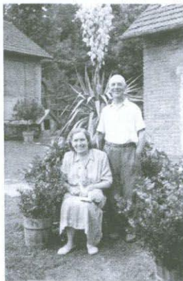
Obr. 1: Rodiče před jednou z tatínkových palem (asi rok 1955).

Když otec přišel k večeru z práce, obhlédl zahrádku, z potoka nanosil vodu na zalévání a pak šel ke včelínu. Zahrádka a včely, to byly jeho lásky. Kolem chalupy to bylo samý kvítek. A nebyly to rostliny ledajaké, které tatínek pěstoval. Náhodnému návštěvníku, pokud by tehdy zabloudil do Ostaše, se musel naskytnout opravdu nečekaný pohled. Na dobové fotografii sedí tatínek s maminkou na lavičce před chalupou, obklopeni vzrostlými bujnými palmami rostoucími přes léto na zahrádce v obrovských bečkách. Takovou scénérii by člověk čekal spíš někde v Egyptě nebo snad v botanické zahradě či v zámecké oranžerii, ale na zahrádce prostě dřevěné chalupy pivovarského dělníka a tkadleny z textilky působila skutečně překvapivě. Oba synové jenom s obavami oče-