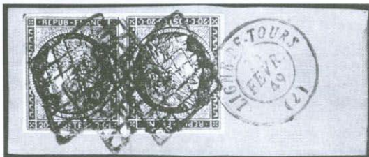
Výstřizek s padělkem protichůdné dvojice 20 c Ceres.

Ale nic netrvá věčně. Jednomu z obchodníků se nelíbilo, že nabízená francouzská protichůdná dvojice 20 centimů, nalepená na výstřizku, má uprostřed známek lom, a vyjádřil pochybnost, zda nejde o dvě k sobě přilepené známky. Prodávající nehnul brvou a druhý den přinesl jiný výstřizek, s další protichůdnou dvojicí, tentokrát nepochybně nepřeloženou. To už ovšem obchodník pojal silné podezření, že něco není v pořádku; známky této vzácnosti se u nás totiž prakticky nevyskytují,