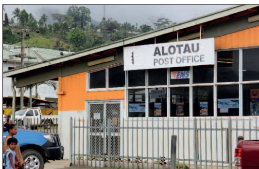
Pošta v městečku Alotau...

Jak už to tak v chudých zemích paradoxně bývá, věci se tu prodávají draž, než v zemích bohatých, což platí i pro PNG. Pohled na poště stál 3 kina (cca 27 Kč) a známka do Evropy 8,60 kina (77 Kč), tedy mnohem víc, než v sousední Austrálii.