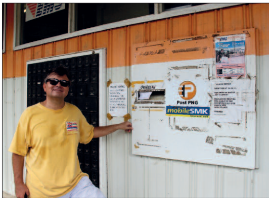
... a její zrušená poštovní schránka.

Když už jsem tu byl, samozřejmě jsem si chtěl vyfotografovat místní poštovní schránku, což paní za přepážkou nechápala – pohledy přece můžu podat u ní a schránka je už rok zrušená! Nakonec mi ji ukázala, byla venku, za rohem, zasazená v obvodové zdi pošty, vedle nonstop přístupných post boxů, a skutečně na ní viselo „Veřejné oznámení: Od dnešního dne, 26/9/2013, je poštovní schránka zavřena! Všechny záсылky je třeba podávat na přepážce. Děkujeme. Management pošty PNG“. Tak jsem se vyfotografoval alespoň se zrušenou schránkou – jinou jsem tu nenašel, ani se na ni nedoptal.