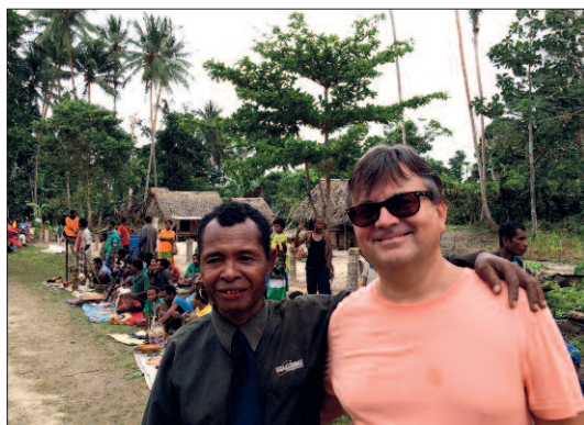
Místní důležitý muž (soudě dle respektu, který požíval u zdejších obyvatel) na ostrově Kiriwina, který mi ochotně ukázal cestu k poštovní schránce, značně však vzdálené. Tak jsem se s ním alespoň vyfotografoval.

Stejná situace byla na malých ostrovech, na nichž jsme se postupně zastavili. Někde sice v improvizovaných přístřešcích vedli pohlednice a někde dokonce i známky, ale poštu ani schránku neměli, a na dotaz, jak je máme odeslat, nám svorně radili, ať si je vezmeme sebou na loď, třeba narazíme na schránku jinde. Výjimkou byl větší ostrov Kiriwina, na kterém jsem se na schránku doptal, a dokonce mi ukázali směr, kterým se nachází; našťástí jsem se ale prozíravě zeptal i jak je to daleko - ukázalo se, že dvě a půl hodiny chůze... Takže fotografií kiriwinské poštovní schránky nemám, neboť taxíky zde neměli a blátivá cesta směřující do pralesa mě k tak dlouhé pěší výpravě nezhládala.