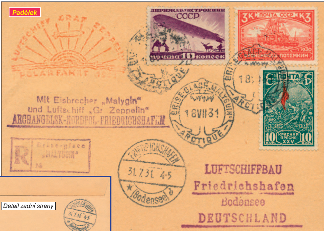
Detail zadní strany