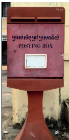
Schránka před poštou.

Na okraji přímořského města Sihaonokville jsem navštívil poštu sídlící ve výstavně budově, s dvojicí poštovních schránek vedle vjezdu. Na psaníchtivé turisty ale mysleli i celníci v přístavu, kteří u svého stánku měli objemnou improvizovanou schránku s výmluvným anglickým nápisem.