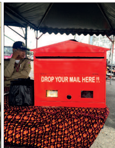
Schránka v přístavu.