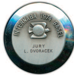
Basilej 1974 - medaile pro členu jury

Medaile Philakorea 2002, k tomu byl přiložen certifikát se složením: 99,9 % stříbro, pozlacení 1 mikron, váha 160 g, průměr 50 mm, proof.