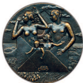
Nahore zmenšeno na 70 %, dole 1 : 1.