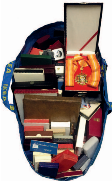
Jedna ze dvou tašek Ikea s medailemi LD.