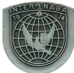
Basilej 1974 - národní komisař