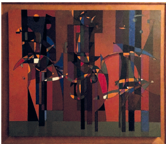
Obrazem Stráž u mrtvého Matal připomněl smrt filosofa Jana Patočky, mluvčího Charty 77, který zemřel po jedenáctihodinovém výslechu na StB.

Na fotografii vidíme, jakým vývojem Matal prošel za dvě desetiletí, která vznik obou prací od sebe dělí.