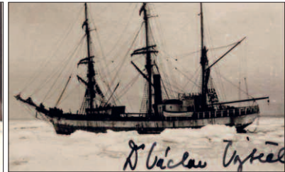
Václav Vojtěch na fotografii s jeho podpisem, a loď, na které se do Antarktidy plavil. Dole jeho dopis.