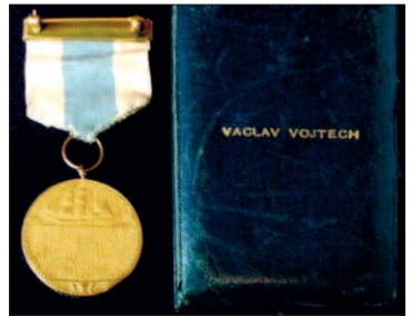
Vojtěchova Zlatá medaile Kongresu USA a stužka, která k tomuto ocenění patří.