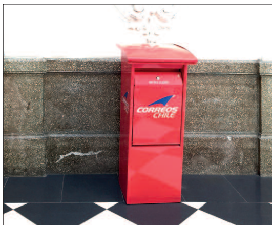
Moderní poštovní schránka stála v hale.

U východu z pošty jsme našli nenápadnou prodejničku věnovanou filatelii a koupili si tu za nominál hezké námětové známky na pohlednice. Měli jich velký výběr, tedy jako na filatelistických přepážkách Hlavní pošty v Praze, na rozdíl od nás však krásné známky nabýzely i menší pošty v dalších chilských městech a vesnicích, což je stav, k němuž u nás máme bohužel ještě daleko.