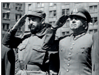
A. Pinochet na fotografii s jiným úspěšným povstalcem, komunistou Fidelem Castrem.

Když o necelé dva týdny později zemřel chilský básník Pablo Neruda, komunista a blízký Allendeho spolupracovník, nabyl u nás pocit sounáležitosti s chilským lidem nového rozměru. Laureát Nobelovy ceny za literaturu přitom svůj český pseudonym zvolil náhodně a vůbec tehdy netušil, kým se inspiroval: „V jednom časopise jsem našel toto české jméno, a ani jsem netušil, že jde o velkého spisovatele, uctívaného veškerým lidem, autora balad a překrásných románů, jemuž postavili pomník na Malé Straně v Praze. Když jsem po mnoha letech přijel do Československa, položil jsem k nohám jeho vousaté sochy květ.“