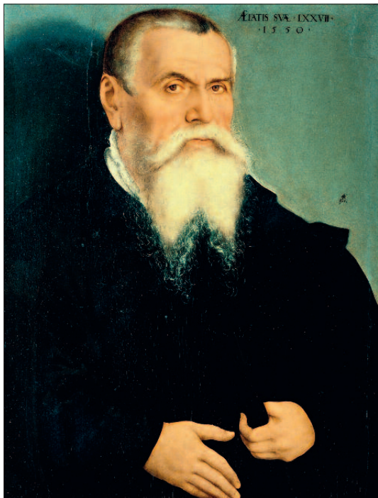
Cranach v průběhu doby dospěl k velmi modernímu výrazu, jako tady na svém autotypu, který namaloval ve věku 77 let.

obrazů, z nichž se dochovala asi pětina. K tomu množství dřevorezů, a ještě si přilepšoval provozem tiskárny a lékárny a obchodem s barvami a vínem. Vskutku renesanční člověk! Z jeho pěti dětí se dva synové – Jan a Lukáš mladší - proslavili rovněž jako malíři, a tohle povolání se v rodině dědilo po čtyřech generacích. O jeho lékárně se uvádí, že fungovala až do roku 1880!