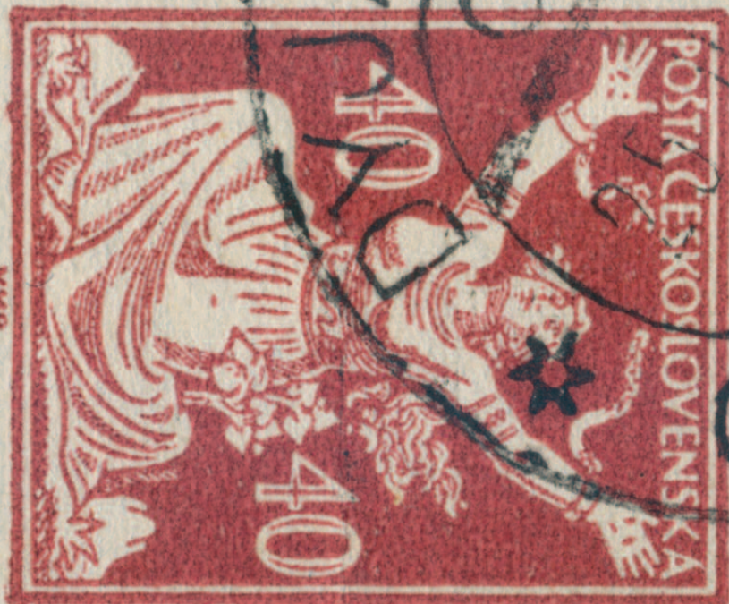
Razítkovaná dvoupáska s dolním okrajem s počítadly, obsahující ZP 95 a 96/5, tedy se spojenými typy.