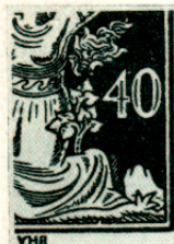
Obr. 496a. I. typ — devět lístků v keři

Pokud jde o označení desky u I. typu, známe dosud celkem tři různá označení, jak je uvedeno na str. 279.