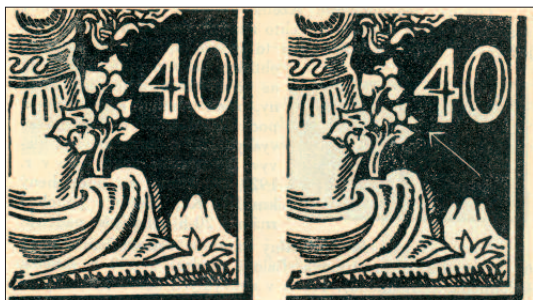
I. typ II. typ

Typy. Typické rozdíly v kresbě nacházíme pouze u hodnoty 40 h, kde rozlišujeme dva typy. Jejich rozdíl záleží v kresbě lípových lístků, jichž vidíme u I. typu (stejně jako u všech hodnot ostatních) devět , u II. typu však zdláhlivě deset . Ve skutečnosti nejde o lípový lístek, nýbrž o typickou skvrnu, která se opakuje na všech známkách v archu, takže se musela nacházet již na fotografické desce, z níž byla zhotovena tisková deska.