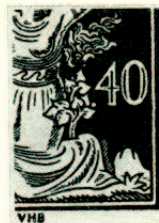
Obr. 496b. II. typ — deset lístků v keři