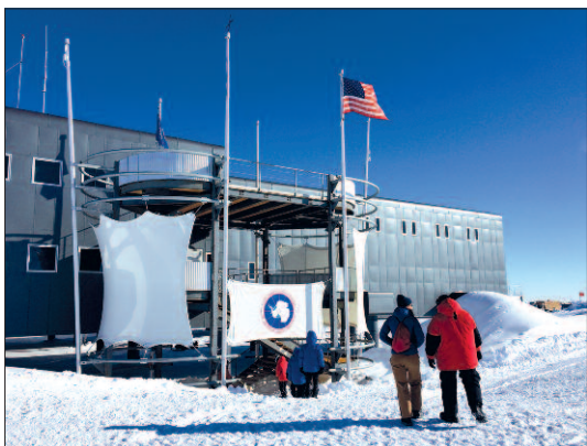
Vchod do základny.

různé časy – my se řídili chilským a základna novo-zélandským (kvůli synchronizaci se základnou McMurdo), a ty se od sebe liší o 16 hodin!