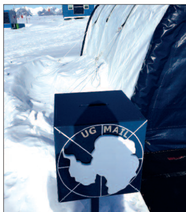
Nejjihnější umístěná veřejně přístupná poštovní schránka světa na chilské základně Union Glacier Camp v Antarktidě.

Z chilské základny Union Glacier jsem žádnou korespondenci nezaznamenal, a není vyloučeno, že snímek poštovní schránky, která s námi přiletěla z Punta Arenas a byla hned nainstalována, je vůbec první publikovaný (viz minulá část článku). Zásilky z ní však zřejmě ponese otisk poštovního razítka z Punta Arenas (kam je přepraví nákladní letadlo), a místo odesílání bude připomenuto jen táborovým kašetem.