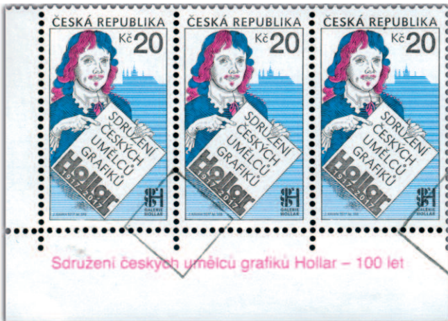
Sdružení českých umělců grafiků Hollar – 100 let