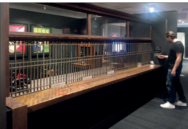
Původní přepážka tokijské pošty ze 20. let.