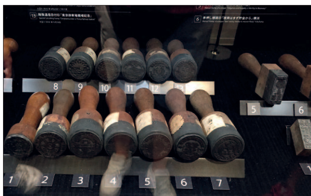
Mnoho pozornosti je věnováno poštovním razítkům.