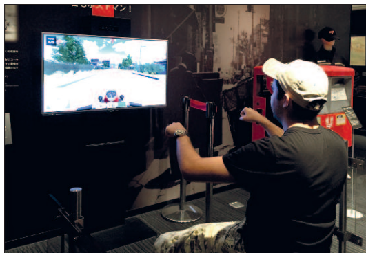
Návštěvníci si mohou virtuálně vyzkoušet doručování pošty v ulicích na motorové tříkolce.