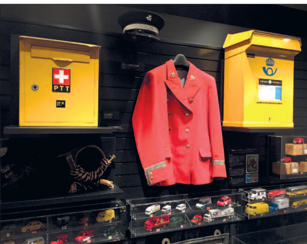
Část prostoru je věnována zahraničním poštovním schránkám, uniformám a modelům a poštovních dopravních prostředků, především automobilů.