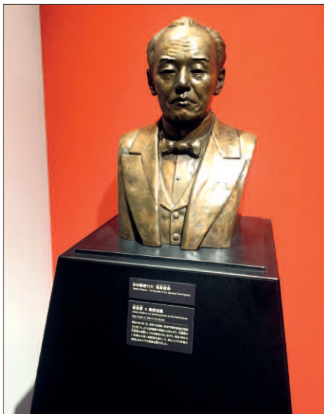
Zakladatel japonského moderního poštovníctví Hisoka Maejima je připomenut bustou.

U vchodu do muzea je umístěna historická poštovní schránka, podobné ojediněle dodnes slouží poštovnímu provozu a vzácně se s nimi tedy můžete setkat i na ulici.