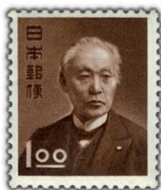
Baron Maejima Hisoka (1835-1919)

Byla to totiž právě jeho poštovní reforma, která velkou měrou napomohla otevření Japonska světu. Už od starověku zde sice působily různé systémy vnitrostátního poštovního spojení, především kurýrní, ale až v roce 1870 Maejima prosadil zavedení státní pošty, zpočátku mezi Tokiem a Osakou, od roku 1872 už monopolně na celém území státu, s jednotnými poštovními tarify, a soukromé pošty byly zakázány. V roce 1875 byl zaveden mezinárodní poštovní styk (jako první do něj byly zařazeny Spojené státy) a o dva roky později se Japonsko stalo členem UPU.