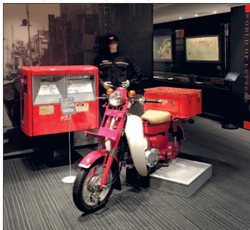
Motocykl a poštovní schránka ze 60. let.