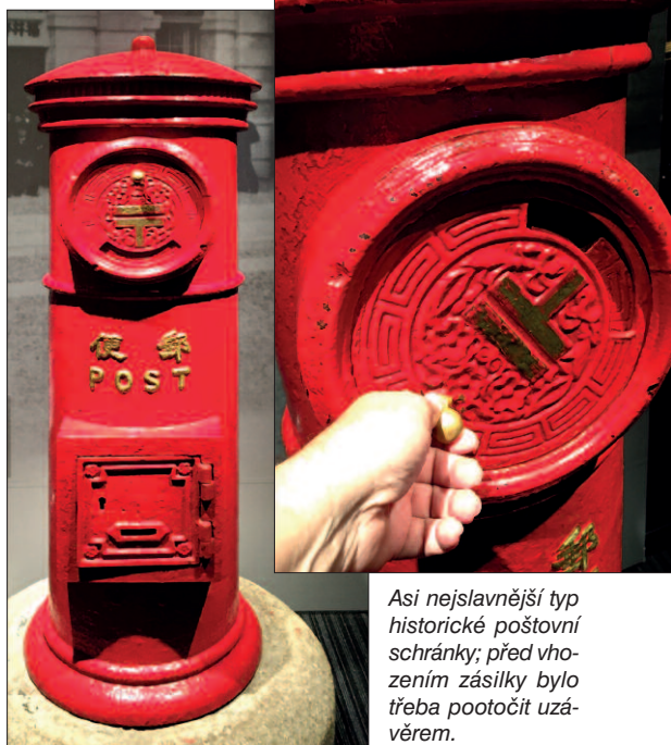
Asi nejslavnější typ historické poštovní schránky; před vhozením zásilky bylo třeba pootočit uzávěrem.