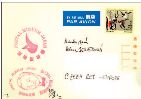
V muzeu je i prodejna známek a dalšího zboží pro filatelisty. Když si tu koupíte pohlednici, můžete ji vhodit do schránky ve stylizované podobě zdejší věže – a před tím i opatřit propagačním kašetem.

Muzeum je otevřeno každý den od 10 do 17,30 hodin a vstupné činí 300 jenů (cca 70 Kč), studenti platí polovic.