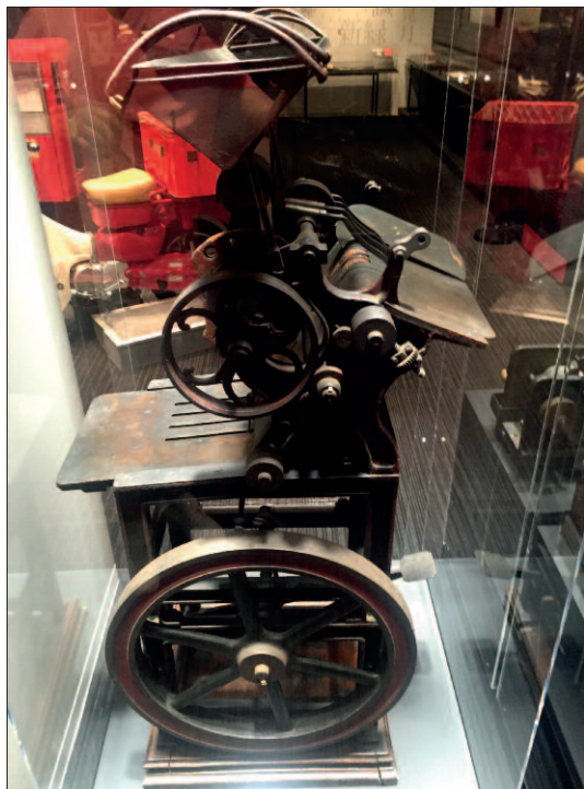
Stroj na razítkování.