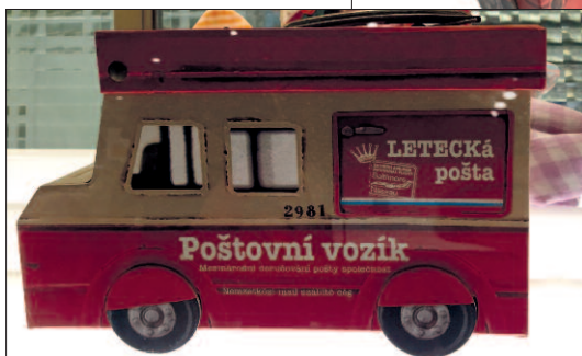
Bonboniéra ve tvaru poštovního autíčka – tahle dokonce s českými nápisy!