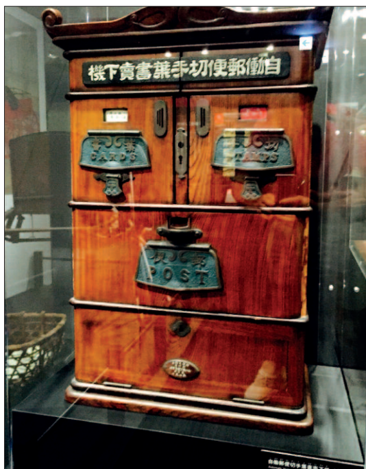
114 let starý prodejní automat na známky a pohlednice.