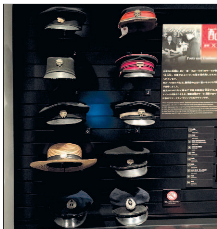
Součástí expozice je samozřejmě řada poštáckých uniforem.