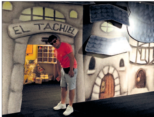
Muzeum je vlněné k nejmenším návštěvníkům, je tu pro ně pohádková poštovní úřadovna s přepážkami a zásilkami.