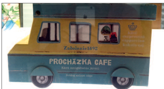
Další, opět „česká“, tentokrát v podobě pojízdné kavárny.

Muzeum je otevřeno každý den od 10 do 17,30 hodin a vstupné činí 300 jenů (cca 70 Kč), studenti platí polovic.