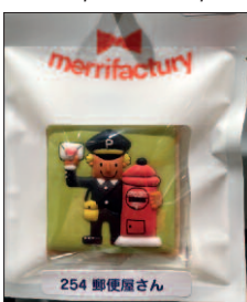
Jedna z řady populárních sušenek, tahle v podobě pošťačky se schránkou.