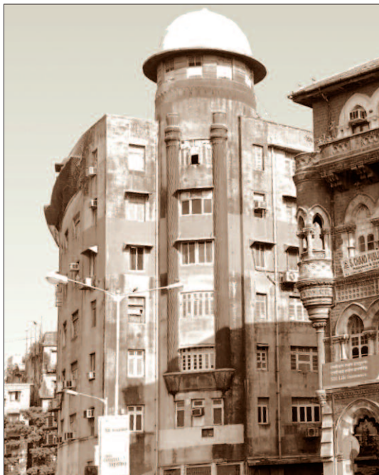
Sídlo Biblické společnosti v Bombaji, sem byl adresován slavný dopis.

A proč o tom tak podrobně píšou? Jak v roce 1969 uvedl Harmer: „ Nic z toho není ve středu zájmu filatelistů, ale protože jde o souvislosti s nejvýznamnějším předmětem ve světové filatelii, je třeba to zaznamenat. “