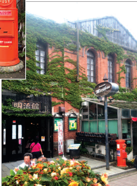
Starobylá (před budovou historické pošty) ...