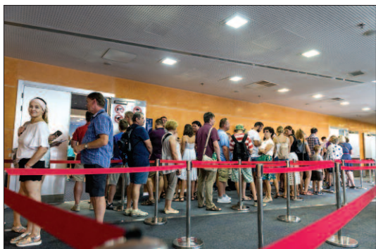
...letos prohlídka probíhala o poznání rychleji.

Minule šlo o exempláře z britské královské sbírky, letos byl vystaven v současnosti největší soubor na světě, pocházející ze sbírky českého filatelisty.