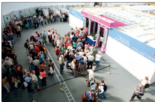
Fronta na Mauritie na výstavě PRAGA 2008...

Už se stalo vlastně tradicí, že na výstavách PRAGA se největšímu zájmu návštěvníků těší nejslavnější světové rarity, tedy první známky ostrova Mauritius s nápisem Post Office. Na jejich zhlédnutí jsou ochotni vystát dlouhé fronty, jak jsme mohli vidět před deseti lety i na výstavě letošní.