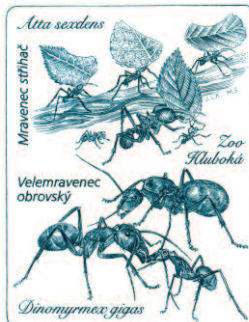
ZOO Hluboká mravenec stříhač velemravenec obrovský