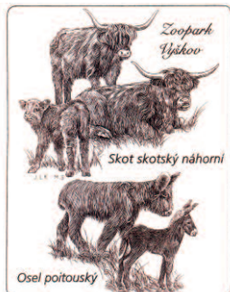
ZOOPARK Vyškov skot skotský náhorní osel poitouský