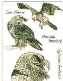
ZOO Liberec orlousup bradatý