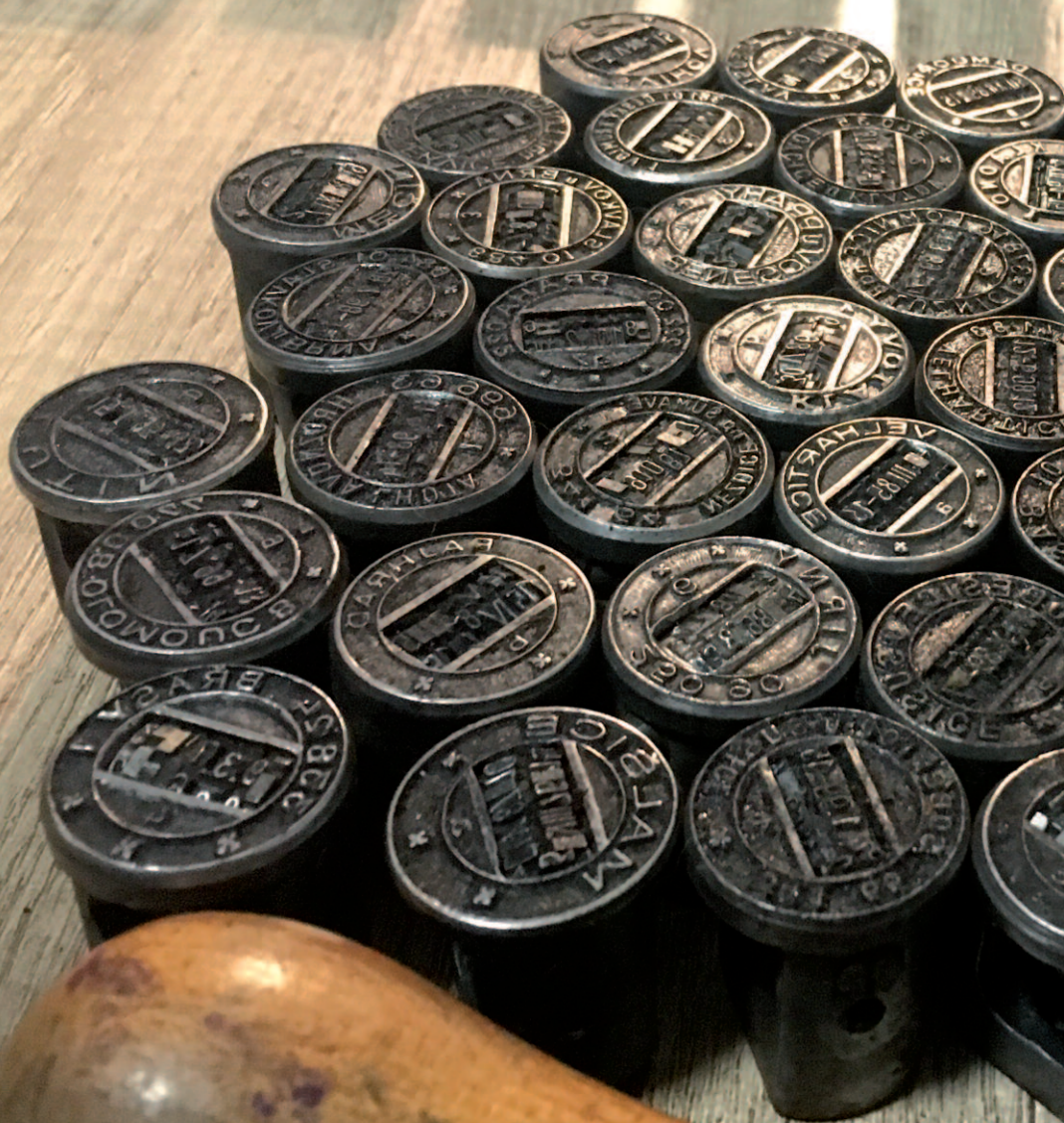
Ukradená razítka, jak je vyfotografoval jejich prodejce.