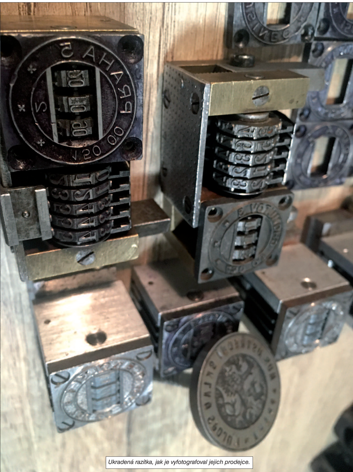
Ukradená razítka, jak je vyfotografoval jejich prodejce.