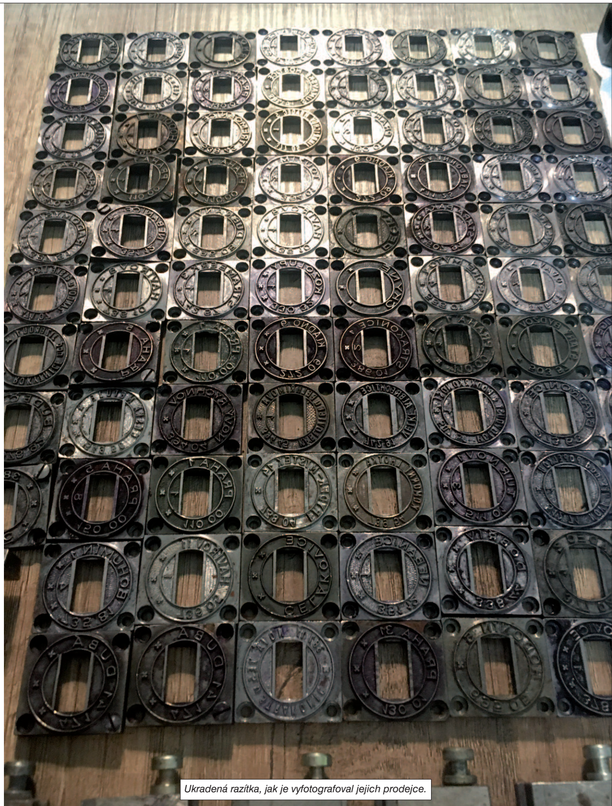
Ukradená razítka, jak je vyfotografoval jejich prodejce.