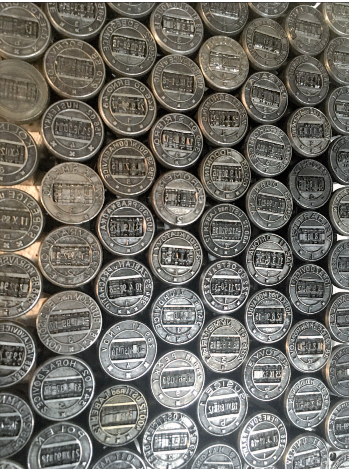
Ukradená razítka, jak je vyfotografoval jejich prodejce.